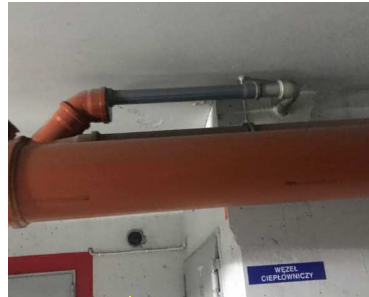
podłączenie pompy WC do kanalizacji sanitarnej