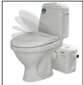
pompa WC z rozdrabniaczem + kompakt