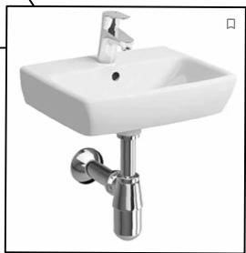
umywalka ścienna z baterią i syfonem